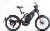
Albero 2.5 - Rjav