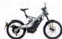
Albero 2.5 - Srebrn